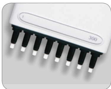
安全圆锥过滤器保护移液器免受污染。

移液器吸头圆锥中使用的可更换安全圆锥过滤器可充当保护屏障，防止样本气溶胶和液体污染移液器的内部组件。